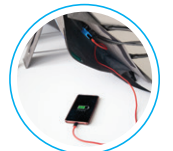
USB Hızlı Şarj Çıkış